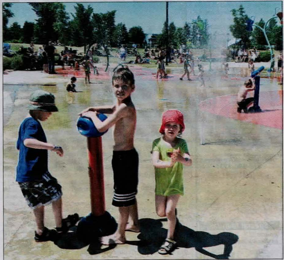
La chaleur et le soleil étaient au rendez-vous sur la zone portuaire.