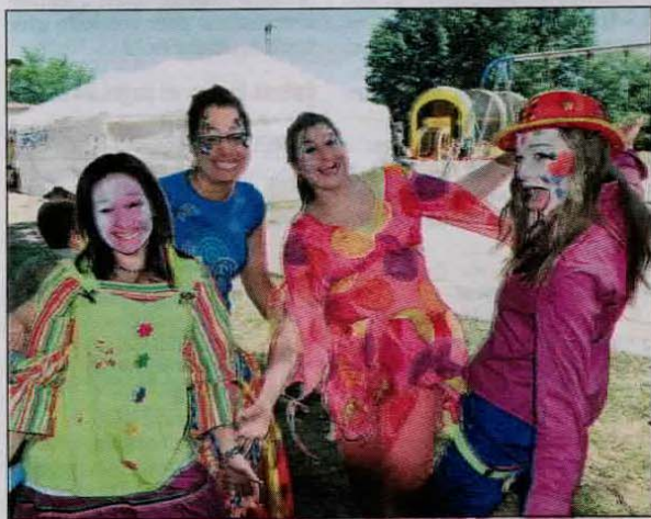
Les clowns étaient sur place pour divertir jeunes et moins jeunes, dans le quartier Saint-Paul.